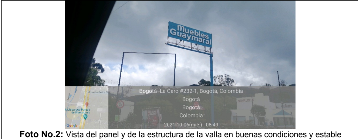
Foto No.2: Vista del panel y de la estructura de la valla en buenas condiciones y estable